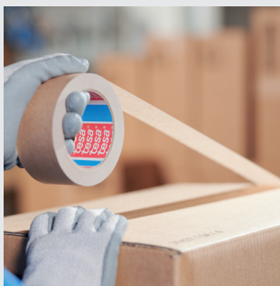
Для легких пакувань