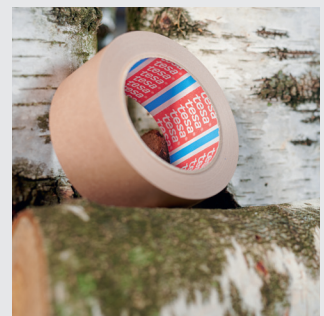
Основа стрічки виготовлена з паперу