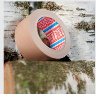
Popierių iš FSC® sertifikuotų miškų bei kitų kontroliuojamų šaltinių