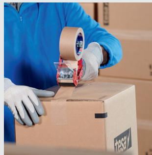
Puikus sukibimas su įvairių tipų perdirbtu kartonu