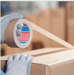
Tinka lengvoms pakuotėms