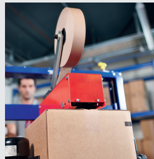
Tinka rankiniam ir automatiniam užklijavimui