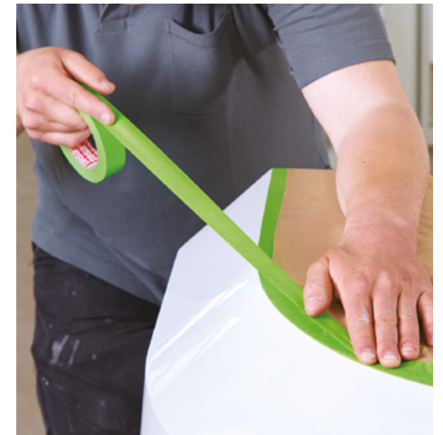
Gran nivel de adhesión inicial