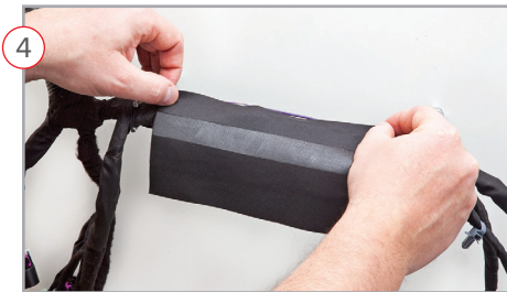
4 Inner adhesive strip is applied to bundle as a starting point, the exterior sealing strip will be facing outside of the sleeve wrap La línea de ayuda de fijación se coloca sobre los circuitos y la línea de sellado deberá de estar posicionada hacia afuera del arnes