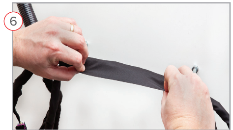
6 Inner sealing strip is secured to the outer sealing strip, hand pressure is applied La línea de adhesivo interior deberá de colocarse sobre la línea de adhesivo exterior y hay que aplicar presión para sellarlo