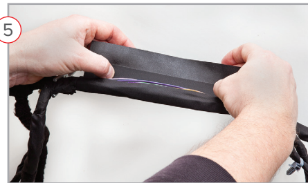
5 Wrap sleeve around bundle Envuelva la manga sobre los circuitos