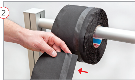
2 → Outer adhesive sealing strip Línea de adhesivo exterior para sellar la manga