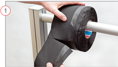
1 Perforated to custom, hand-tearable lengths Perforaciones personalizadas para corte manual