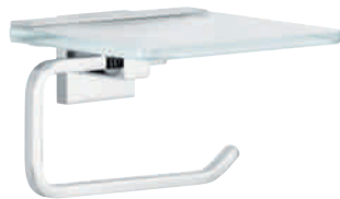
Toilettenrollenhalter mit Ablage