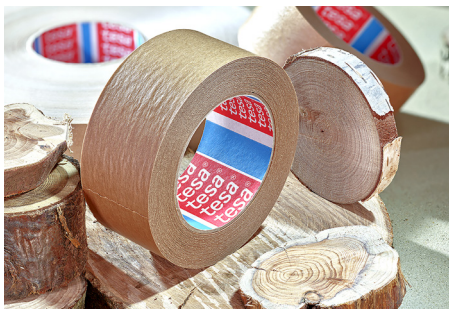
Papier aus nachhaltig bewirtschafteten FSC™-zertifizierten Wäldern und anderen kontrollierten Quellen

Die Kombination aus zertifiziertem Papierträger und lösemittelfreiem Naturkautschukkleber macht dieses Produkt zur perfekten Lösung für Verpackungsanwendungen bis 20 kg. tesa® 60408 kann mit manuellen und automatischen Anwendungen verwendet werden und kann mit allen Arten von Tinten bedruckt werden.