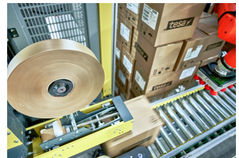
Perfekt løsning for utfordrende emballasjeapplikasjoner (opptil 20 kg)